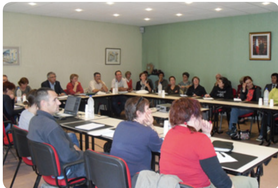
Un comité de pilotage attentif devant les premières préconisations du bureau d'études.

L'étude, confiée à Urbactis, a pour objectif de déterminer les aménagements à réaliser en matière de voirie et liaisons douces, connexion des divers équipements, aménagement des espaces extérieurs, organisation des flux de circulation et du stationnement et de préciser le positionnement du pôle scolaire et de ses différentes composantes.