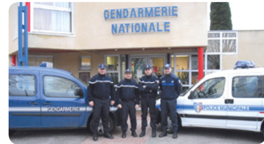
Police municipale et Gendarmerie côte à côte pour la sécurité des Labruguiérois.

Le « Vivre Ensemble » est souvent difficile et il convient de rappeler certaines règles citoyennes de la République.