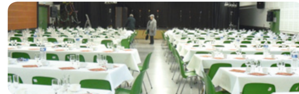
Un bel espace à hauteur des ambitions de la ville.

Ces salles, indispensables pour les grandes fêtes familiales et les grands rassemblements que sont les bals, les lotos ou les congrès, vont être reliées agréablement au Centre Culturel voisin. Ainsi le centre ville sera occupé, animé et embelli de la plus belle manière.