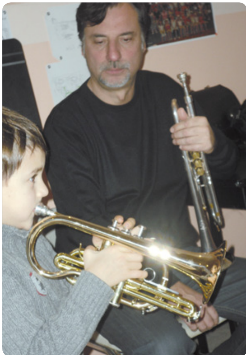
Les jeunes Labruguiérois bénéficient d'un enseignement musical de grande qualité.

L'antenne de Labruguière compte, pour cette année scolaire 2010-2011, une quarantaine d'élèves qui se répartissent, par ordre de préférence, dans les instruments suivants : Piano, Clarinette, Guitare, Contrebasse, Trompette, Batterie, Flûte traversière et Violon, ainsi que l'Éveil Musical pour les plus jeunes. Ces élèves musiciens peuvent suivre également les cours de Formation Musicale de l'antenne jusqu'à la fin du Cycle I.