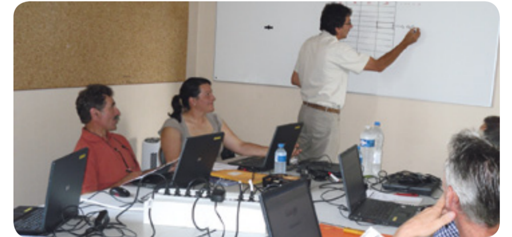
L'informatique permettra une réactivité plus grande des services.

L'amélioration de l'offre des services municipaux est un souci constant pour permettre une bonne qualité de services.