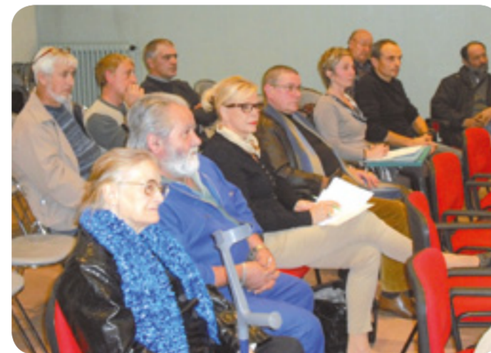
Réunion de concertation, le 19 novembre, en présence d'un notaire, du conciliateur de justice et d'un géomètre.

Oui, car c'est dans ce hameau que la demande est antérieurement la plus forte. Pendant la campagne électorale, nous nous étions engagés à ouvrir ce dossier délicat. Il faut maintenant poursuivre la concertation pour qu'un consensus se dessine entre les souhaits de chacun.