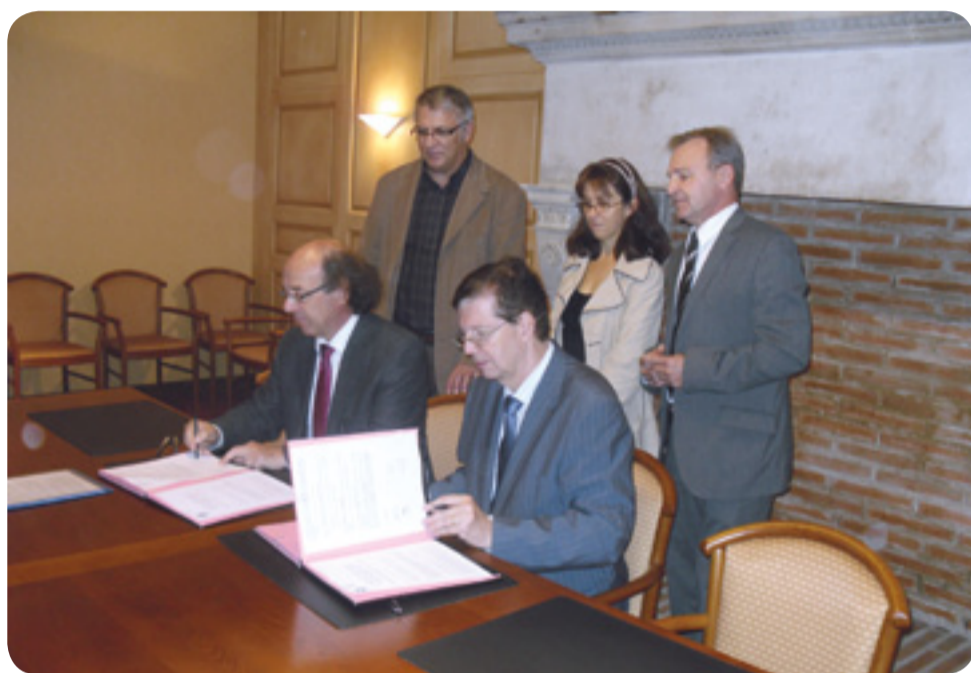
Le musée Arthur Batut va prendre un nouvel élan.